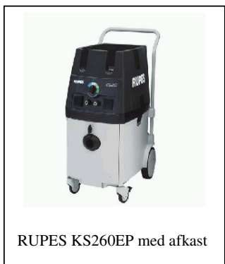
RUPES KS260EP med afkast