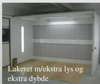
Lakeret m/ekstra lys og ekstra dybde