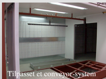
Tilpasset et conveyor-system